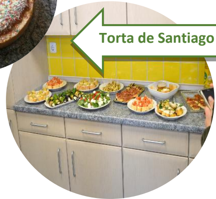
Torta de Santiago